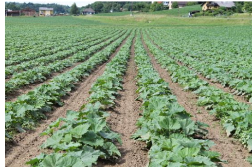
Variante gedüngt mit BioAgenasol® (Stand 13. Juni)

Zusammengefasst kann festgehalten werden, dass die Nitratuntersuchungen im Boden zeigten, dass BioAgenasol® eine gleichmäßige Nitratversorgung liefert und es zu keinem wesentlichen Nitratanstieg im Boden kommt. Positiv sind auch die sehr geringen Nitratmengen im Boden gegen Vegetationsende, die Messung Ende Oktober zeigte bei der Fläche, welche mit BioAgenasol® gedüngt wurde einen Reststickstoff im Boden von lediglich 20 kg NO 3 -N/ha. Sowohl bei der Volldüngervariante als auch bei der Kontrollvariante lagen die Werte deutlich höher. Durch die stattfindende Grundwasserneubildung in den Wintermonaten kommt es somit zu keiner weiteren Nitrat-Belastung des Grundwassers. Ebenfalls konnte durch die durchgeführten Sickerwasseruntersuchungen ein eindrucksvolles Ergebnis gespiegelt werden. Die hier gemessene Nitratkonzentration zeigte ein mäßiges Niveau, sodass von keiner Belastung für das Grundwasser durch BioAgenasol® auszugehen ist.