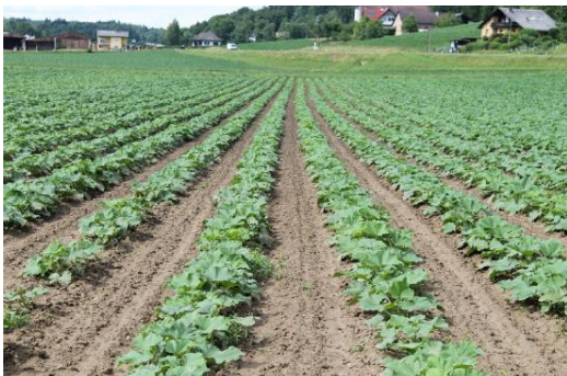
Kontrollvariante (Stand 13. Juni)

Die Bonitur des Bestandes ergab, dass die Düngervariante mit BioAgenasol® der Volldüngervariante um nichts nachstand, bzw. bei der Ernte – bei praktisch gleichem Tausendkorngewicht - ebenfalls ein hoher Ertrag geliefert werden konnte.