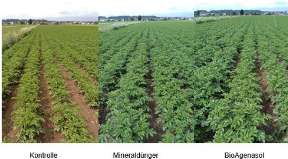
Abb. 2: Verschiedene Düngevarianten am 22. Mai 2018.

Die Gesamtbodenuntersuchung zeigte, dass Phosphor im Bereich C und Kalium im Bereich D liegt. Dies entspricht einer guten Nährstoffversorgung. Der pH-Wert lag bei 6,3 im schwach sauren Bereich. Die Humusgehalte lagen im mittleren Bereich, wobei BioAgenasol® einen Humusanstieg von 0,2% erreichte. Das Stickstoffnachlieferungspotenzial lag ebenso im mittleren Bereich. Besonders auffallend war hier ein rascher Abfall des Stickstoffnachlieferungspotenzials bei der Mineraldüngervariante in den niedrigen Bereich ( < 35\text{mg N}/1.000\text{ g Feinboden} ).